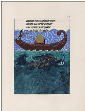
Carl Gustav Jung, Den röda boken.