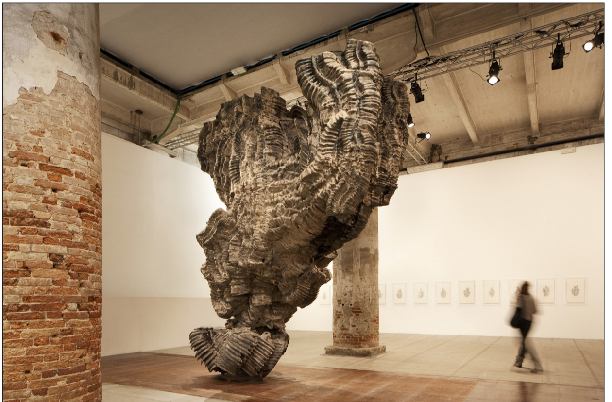
GOTLÄNSK RAUK? Skulptur av Roberto Cuoghi.